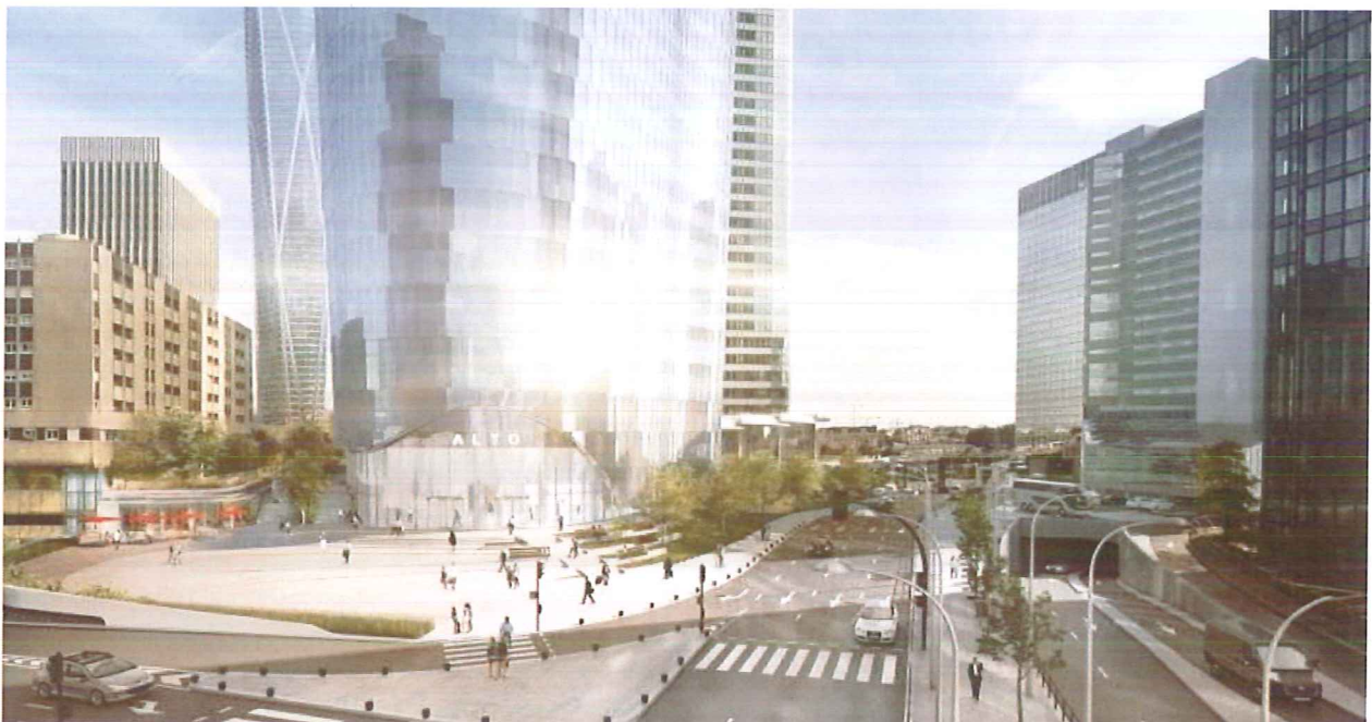
Le projet de la tour Alto - Agence Interfaces Architectures

L'information était connue depuis déjà un long moment. Bouygues a confirmé ce mardi 12 avril avoir emporté auprès du fonds souverain émirati Abu Dhabi Investment Authority (ADIA) un contrat de promotion